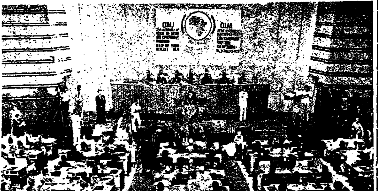
اتها حقيقة في حياة افريقيا ان يستورد تجر في بلد افريقي ناطق بالفرنسية زيت الطبخ من فرنسا ولو ان هذا الزيت ينتج في بلد افريقي مجاور وصحيح ايضا ان رجل الاعمال في لاغوس (العاصمة بيجيريا) لا يستطيع الاتصال بتولونيا مع كينشاسا (العاصمة زائير) دون وساطة أوروبا ، وذلك رغم مرور عقدين على الاستقلال العمومي .

و ٦٤ بالمائة من الخنزير و ٢٥ بالمائة من البورانيون و ١٢ بالمائة من النحاس . تخزين : الخروج من الحلقة المفرجة اما الحلقة النهائية التي اقترها المؤتمر كاساس لسبيل التعاون الافريقي فقد وجهت تحديرا بانه ما لم يتحقق شئ ما لتعديل الوضع المالي في الفترة (ان نشاط الاقتصاد الافريقي الضعيف يجعله خلال السنوات العشرين الاخيرة سيستمر فترة ضمنية اذا ما قيس بمتنار النمو نسبي المستقل . ومع الموافقة الاجماعية للحدود بين والصادرة من صميم القلب على وجوب عمل شئ ما فترها يحق لنا توقع ان ينتج من مؤتمر القمة نتيجة ملموسة ، وكل ما المرته القمة حقا وبقية من ١٤٠ صفحة بين وجود عدد من الطرق للتعاون بين البلدان افريقية اذا ما ارادت تلك ، كما تبين التزامها بهدف اسمى يتل في تحقيق سوق اقتصادية افريقية مع حلول عام الالفين ميلادية .